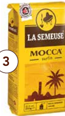
Illustration de l'article Artikelbild